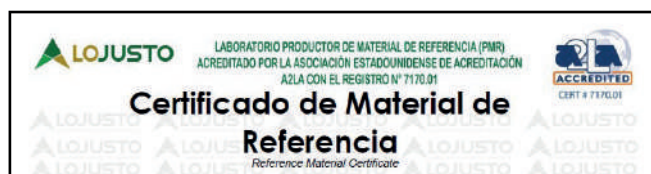
Figura 1: MR Acreditado o MRC

Estos MRC deben cumplir los lineamientos de la norma, que establece, entre otros aspectos, que la estabilidad y homogeneidad [3] deben evaluarse y considerarse dentro de la incertidumbre.